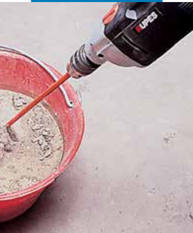
Przygotowanie zaprawy Adesilex P4

Posadzki można poddawać obciążeniu lekkim ruchem pieszym po ok. 4 godzinach.