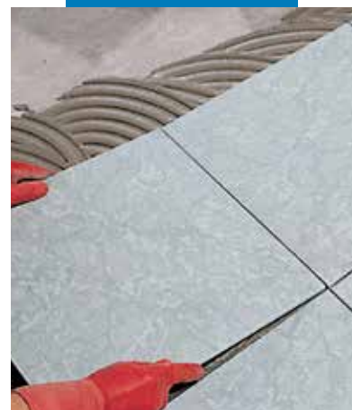
Mpntaż płytek z gresu porcelanowego