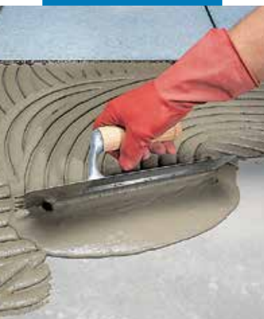
Rozprowadzenie gotowej zaprawy na podłożu za pomocą szpachli zębatej