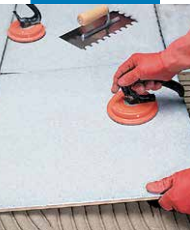
Montaż płytek dużego formatu