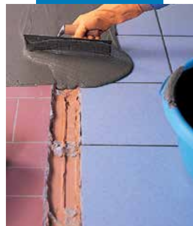
Wyrównanie istniejących podłoży ceramicznych przy użyciu Adesilex P4